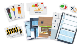
Set di accessori per l'insegnamento dell' intelligenza artificiale