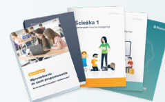
Un set di manuali e guide STEAM