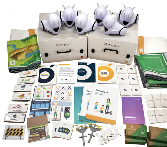
Nota: questa immagine mostra il contenuto della versione PRO

Consigliamo di scegliere la versione base per i gruppi di alunni più piccoli e la variante PRO per le configurazioni di più progetti.