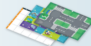
Tre tipi di tappetini educativi: città intelligente, narrazione e a griglia normale