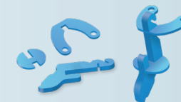
Supporti per dispositivi mobili